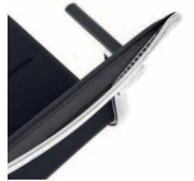
Die-cast aluminium handle