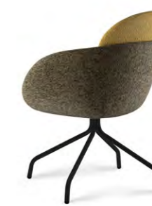
P2 (fissa/ fixed) P10 (girevole/ swivelling)