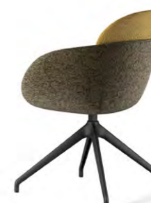
N1/ N1R (with castors/ con ruote)