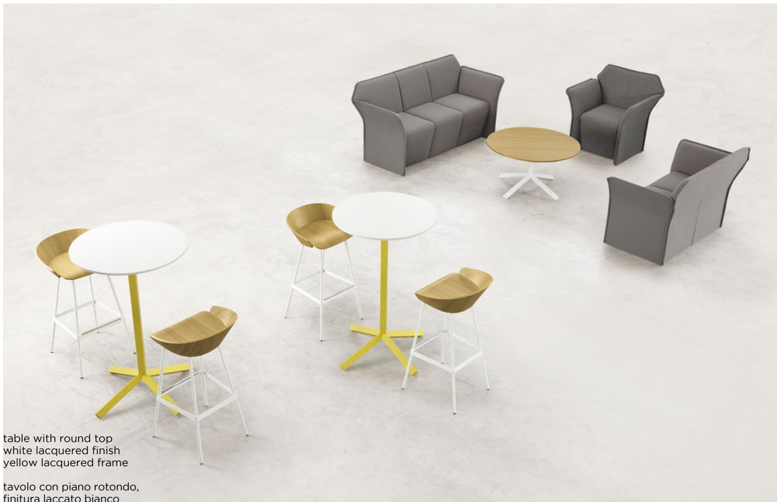
table with round top white lacquered finish yellow lacquered frame

tavolo con piano rotondo, finitura laccato bianco struttura verniciata gialla