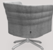
single-seater central round base