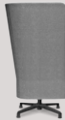
single-seater 4-star base