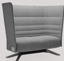
2-seater sofa 4-star wood base