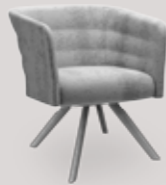
single-seater 4-leg wood base