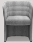
single-seater full-height frame