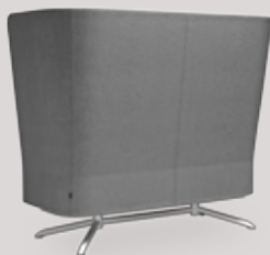
2-seater sofa 4-star base