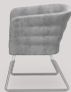
single-seater sled base