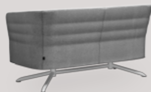
2-seater sofa 4-star base