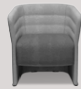
single-seater full-height frame