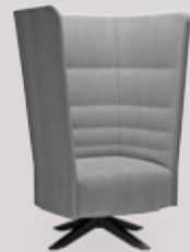
single-seater wood trestle base