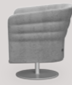
single-seater central round base