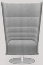
single-seater central round base