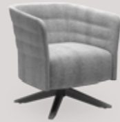
single-seater swivelling wood trestle base