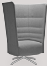
single-seater 4-star base