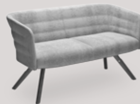
2-seater sofa 4-leg wood base