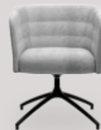
single-seater 4-star base