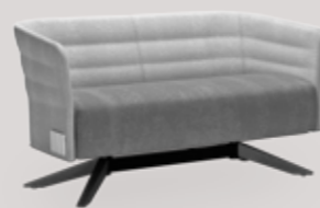
2-seater sofa 4-star wood base