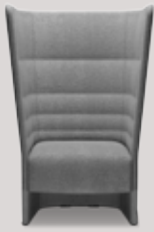
single-seater full-height frame