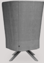
single-seater 4-leg wood base