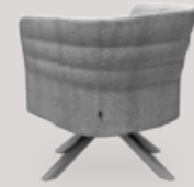
single-seater 4-leg wood base