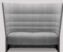
2-seater sofa full-height frame