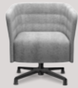
single-seater 4-star base