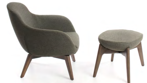
L31 / POUF L15