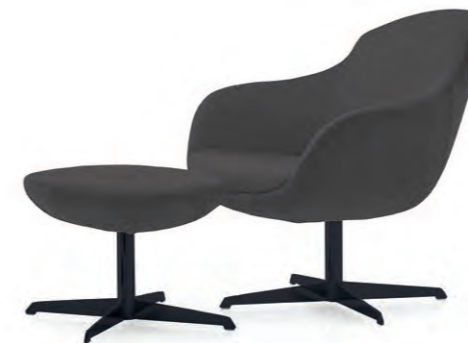
R7/ POUF R8