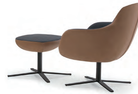
R13/ POUF R14