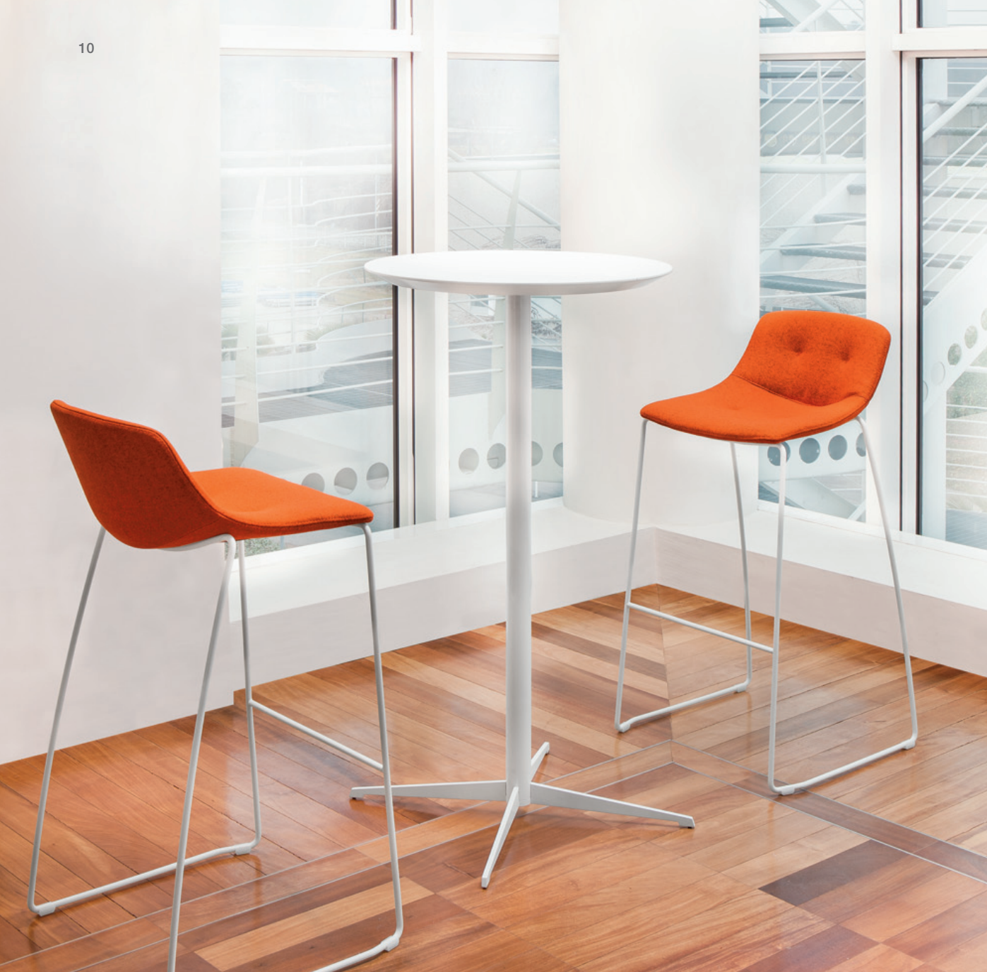
Mod. FR-022 Mod. LL-023